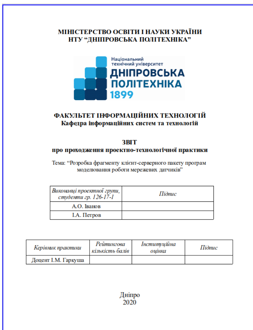
Рис. 3.1. Зразок титульного листа звіту

В тексті звіту пункти відділяються від тексту та назви розділу рядками (рис. 3.2). Шрифт основного тексту та назв пунктів – Times New Roman, кегль 14. Назва пункту – жирним, звичайний текст не виділяють.